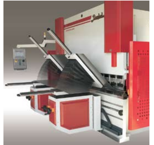
Ön sac kaldırma sistemi Sheet following arms