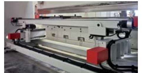
Ağır tip altı eksen arka dayama (X1-X2-R1-R2-Z1-Z2) Heavy duty six axis backgauge (X1-X2-R1-R2-Z1-Z2)