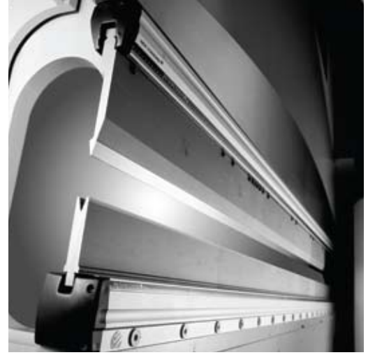
Hidrolik kalıp tutma sistemi Hydraulic tool clamping