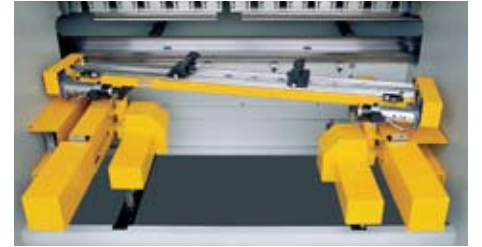
Altı eksen arka dayama (X1-X2-R1-R2-Z1-Z2) Six axis backgauge (X1-X2-R1-R2-Z1-Z2)