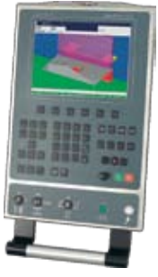
Cybelec ModEva 12 Windows tabanlı, 3 boyutlu, renkli kontrol ünitesi