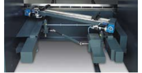
Beş eksen arka dayama (X1-R2-R-Z1-Z2) Five axis backgauge (X1-R2-R-Z1-Z2)

Details of these special backgauge systems are available on request.