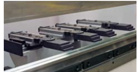
Dokunma sensörlü gezici dayama Touch sensorized finger