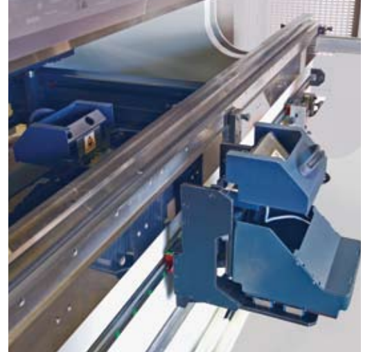
Açı ölçme sistemi Angle measurement