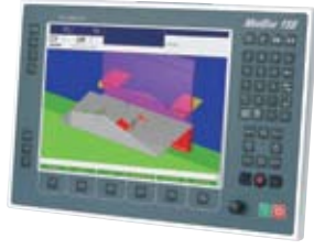
Cybelec ModEva 15S/T Windows tabanlı, 3 boyutlu, renkli kontrol ünitesi