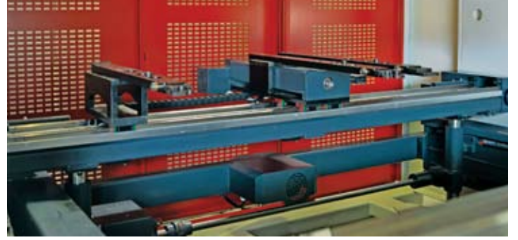
Beş eksen arka dayama (X-R-Z1-Z2-X5) Five axis backgauge (X-R-Z1-Z2-X5)