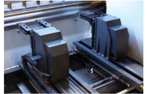
Konsol tip arka dayama (X1-X2-R1-R2-Z1-Z2) Tower type backgauge (X1-X2-R1-R2-Z1-Z2)