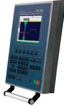
Cybelec DNC-880 Windows tabanlı, 2 boyutlu, renkli kontrol ünitesi