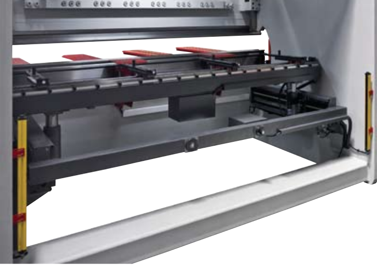
Ağır tip iki eksen arka dayama (X-R) Heavy duty two axis backgauge (X-R)