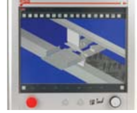
S 560 TOUCH, Windows tabanlı CNC, yenilikçi tasarım ve modüler donanım yapısı