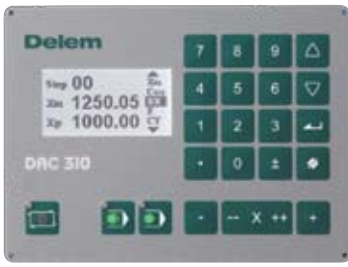
Delem DAC 310