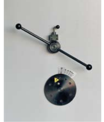
Manuel sentil ayar sistemi Manual blade gap adjustment