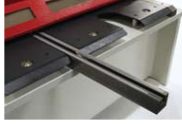
Çetveli, stoperli ve T-kanallı ön destek kolları T-slotted front support arms with scale and flip-stop