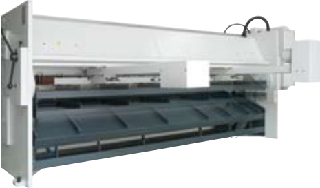
Universal pnömatrik sac destek sistemi Universal pneumatic sheet support system