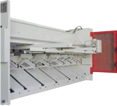
A tipi pnömatrik sac destek sistemi Type A pneumatic sheet support system