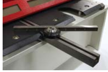
Açılı gönye Angle gauge