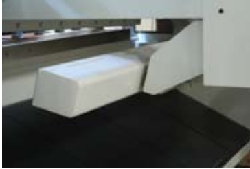
Kalkmalı tip arka dayama sistemi Swing-up backgauge system