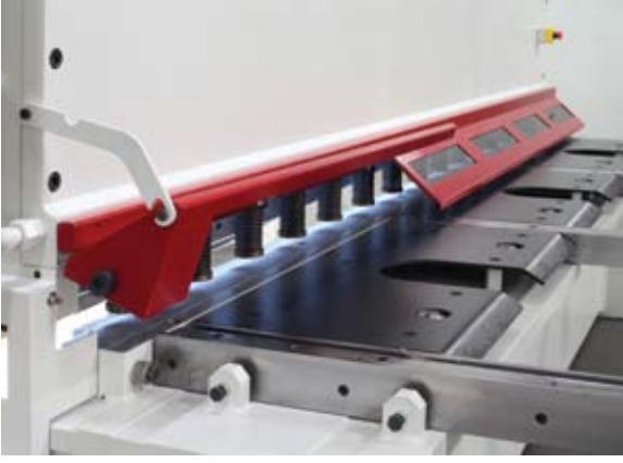
1000 mm açılabilir, emniyet siviçli ön muhafaza 1000 mm lift-up front finger guard with electrically interlocked safety switch