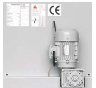
Motorlu sentil ayar sistemi Power blade gap adjustment