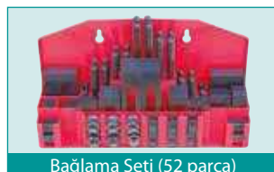
Bağlama Seti (52 parça)