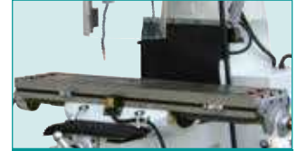
Y & Z Eksen Kızak Koruyucu Körükler