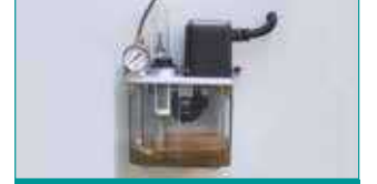
Zaman Ayarlı Otomatik Yağlama