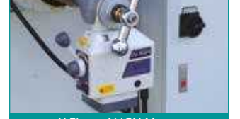
X Eksen ALIGN Motor