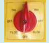
8 Kademeli PAKO Şalter