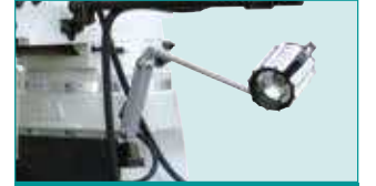
Halojen İş Lambası