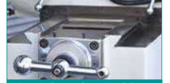
X & Y & Z Eksen Kırılmalı Kızak Sistemi