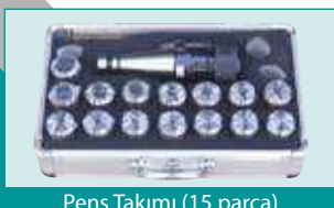
Pens Takımı (15 parça)