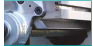
X & Z Eksen Kırılmaç Kızak Sistemi