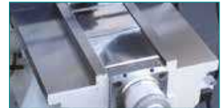
Y Eksen Kutu Kızak Sistemi