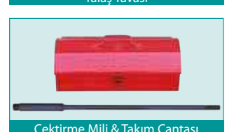
Çektirme Mili & Takım Çantası