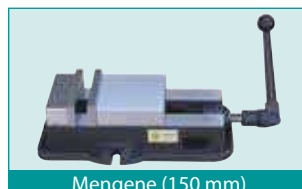
Mengene (150 mm)