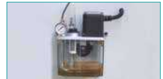
Zaman Ayarlı Otomatik Yağlama