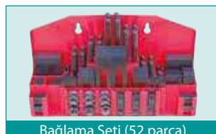
Bağlama Seti (52 parça)