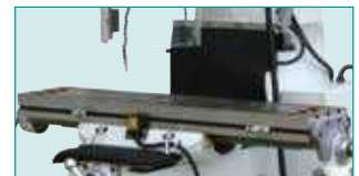
Y & Z Eksen Kızak Korumucu Körükler