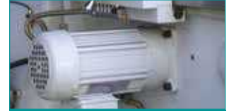
Z Eksen RAPID Motor