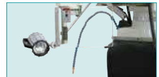
Halojen İş Lambası & İsmili Siperliği & Soğutma Sistemi