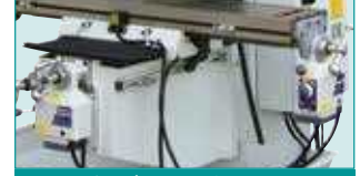
X & Y Eksen ALIGN Motor