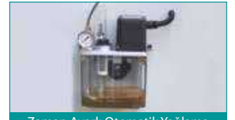
Zaman Ayarlı Otomatik Yağlama