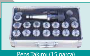
Pens Takımı (15 parça)