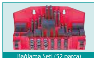
Bağlama Seti (52 parça)