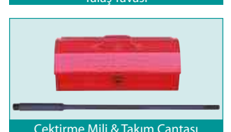
Çektirme Mili & Takım Çantası

Ürünlerin teknik özellikleri ve standart aksesuarlarında önceden bildirim yapmaksızın değişiklik yapma hakkımız saklıdır.