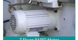
Z Eksen RAPID Motor