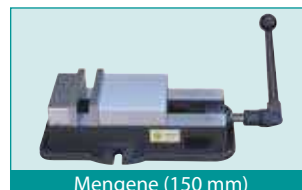
Mengene (150 mm)