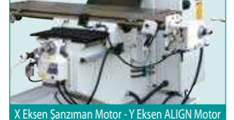
X Eksen Şanzıman Motor - Y Eksen ALIGN Motor