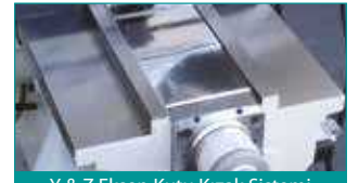
Y & Z Eksen Kutu Kızak Sistemi