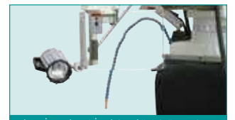
Halojen İş Lambası & İşmili Siperliği & Soğutma Sistemi