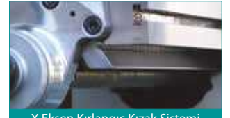
X Eksen Kırılmaç Kızak Sistemi