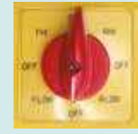
8 Kademeli PAKO Şalter