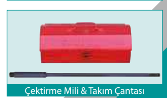
Çektirme Mili &amp; Takım Çantası

Ürünlerin teknik özellikleri ve standart aksesuarlarında önceden bildirim yapmaksızın değişiklik yapma hakkımız saklıdır.