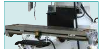
Y &amp; Z Eksen Kızak Korumucu Körükler