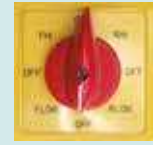
8 Kademeli PAKO Şalter