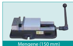
Mengene (150 mm)