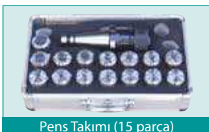
Pens Takımı (15 parça)