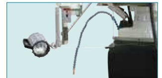
Halojen İş Lambası &amp; İşmili Siperliği &amp; Soğutma Sistemi