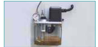
Zaman Ayarlı Otomatik Yağlama