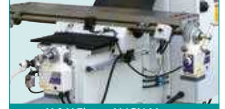
X &amp; Y Eksen ALIGN Motor