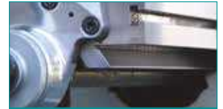
X Eksen Kırılmaç Kızak Sistemi