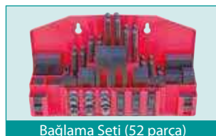
Bağlama Seti (52 parça)