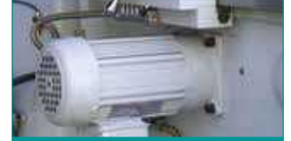
Z Eksen RAPID Motor