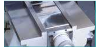
Y &amp; Z Eksen Kutu Kızak Sistemi