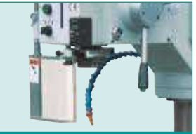
Halojen İş Lambası & İşmili Siperliği