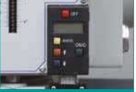
Dijital Derinlik Göstergesi