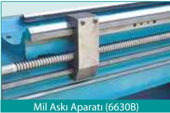
Mil Askı Aparatı (6630B)