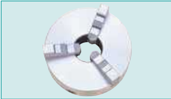
Üç Ayaklı Ayna 250 mm