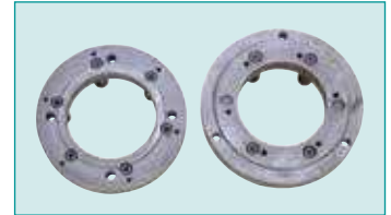
Yedek Ayna Flanşları