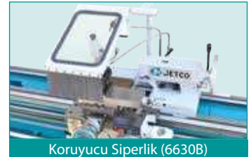
Koruyucu Siperlik (6630B)

Dayanıklı Döküm Makina Gövdesi Taşlanmış ve Sertleştirilmiş Dişli Sistemleri Hızlı İlerlemeyi Sağlayan Butonlu Joystick Kol Sökülebilen Köprü Kızağı Karşı Punta Koniklik Ayarı