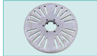
Serbest Ayaklı Ayna 400 mm