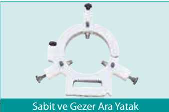
Sabit ve Gezer Ara Yatak