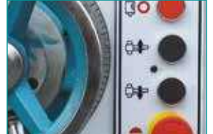
Aşağı &amp; Yukarı Motorlu Hareket