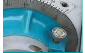
Delme Derinlik Ayar Mekanizması