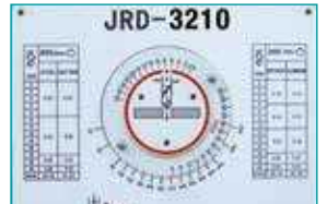
İlerleme &amp; Devir Tablosu