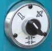
Motorlu Sütun Kilitleme Anahtarı