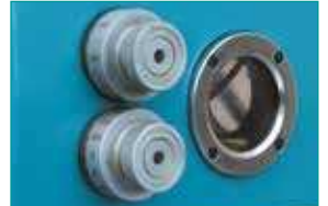
Hidrolik Devir &amp; İlerleme Ayar Skalası