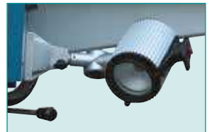
Halojen İş Lambası