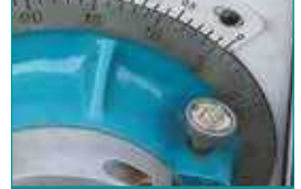
Delme Derinlik Ayar Mekanizması