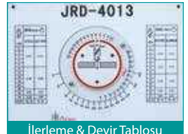
İlerleme & Devir Tablosu