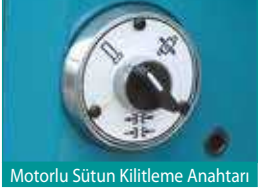
Motorlu Sütun Kilitleme Anahtarı