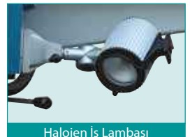
Halojen İş Lambası