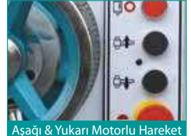
Aşağı & Yukarı Motorlu Hareket