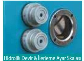
Hidrolik Devir & İlerleme Ayar Skalası