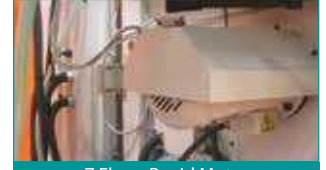
Z Eksen Rapid Motor