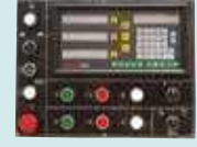
EASSON ES-8 Dijital Gösterge