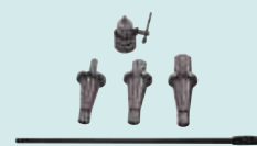
Takımlar &amp; Çektirme Mili