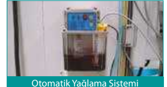
Otomatik Yağlama Sistemi