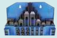
Bağlama Seti (58 parça)