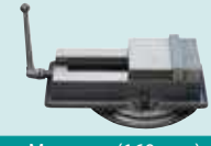
Mengene (160 mm)