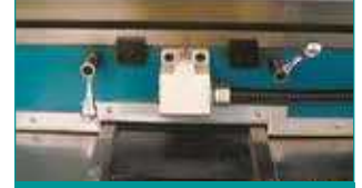
Y/Z Eksen Kutu Kızak Sistemi