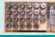
Pens Takımı (23 parça)