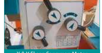
X &amp; Y Eksen Şanzıman Motor