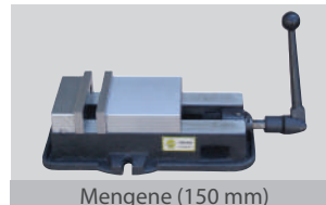
Mengene (150 mm)