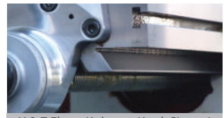
X & Z Eksen Kırılmaç Kızak Sistemi