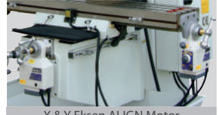
X & Y Eksen ALIGN Motor