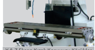
Y & Z Eksen Kızak Korumucu Körükler