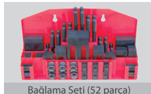
Bağlama Seti (52 parça)