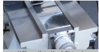
Y Eksen Kutu Kızak Sistemi