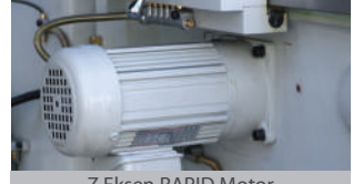
Z Eksen RAPID Motor