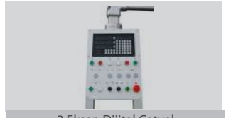
3 Eksen Dijital Cetvel