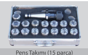
Pens Takımı (15 parça)