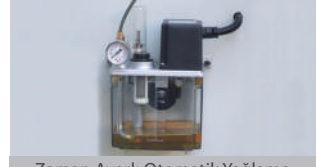
Zaman Ayarlı Otomatik Yağlama