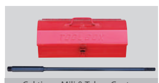
Çektirme Mili & Takım Çantası