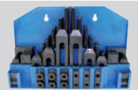
Bağlama Seti (58 parça)