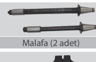
Malafa (2 adet)