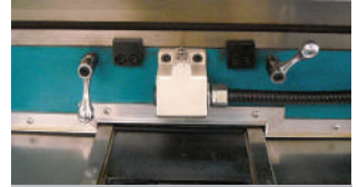
Y/Z Eksen Kutu Kızak Sistemi