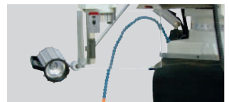
Halojen İş Lambası & İsmili Siperliği & Soğutma Sistemi