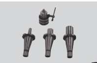
Takımlar & Çektirme Mili