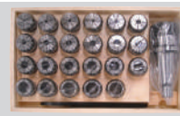
Pens Takımı (23 parça)