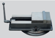
Mengene (200 mm)