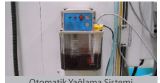
Otomatik Yağlama Sistemi