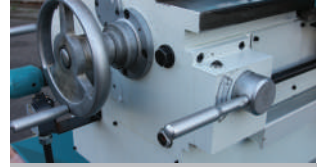
X & Y & Z Eksen Servo Motor